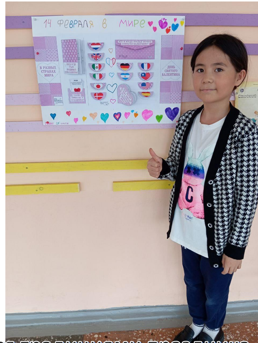
Делимся традициями праздника 14 февраля