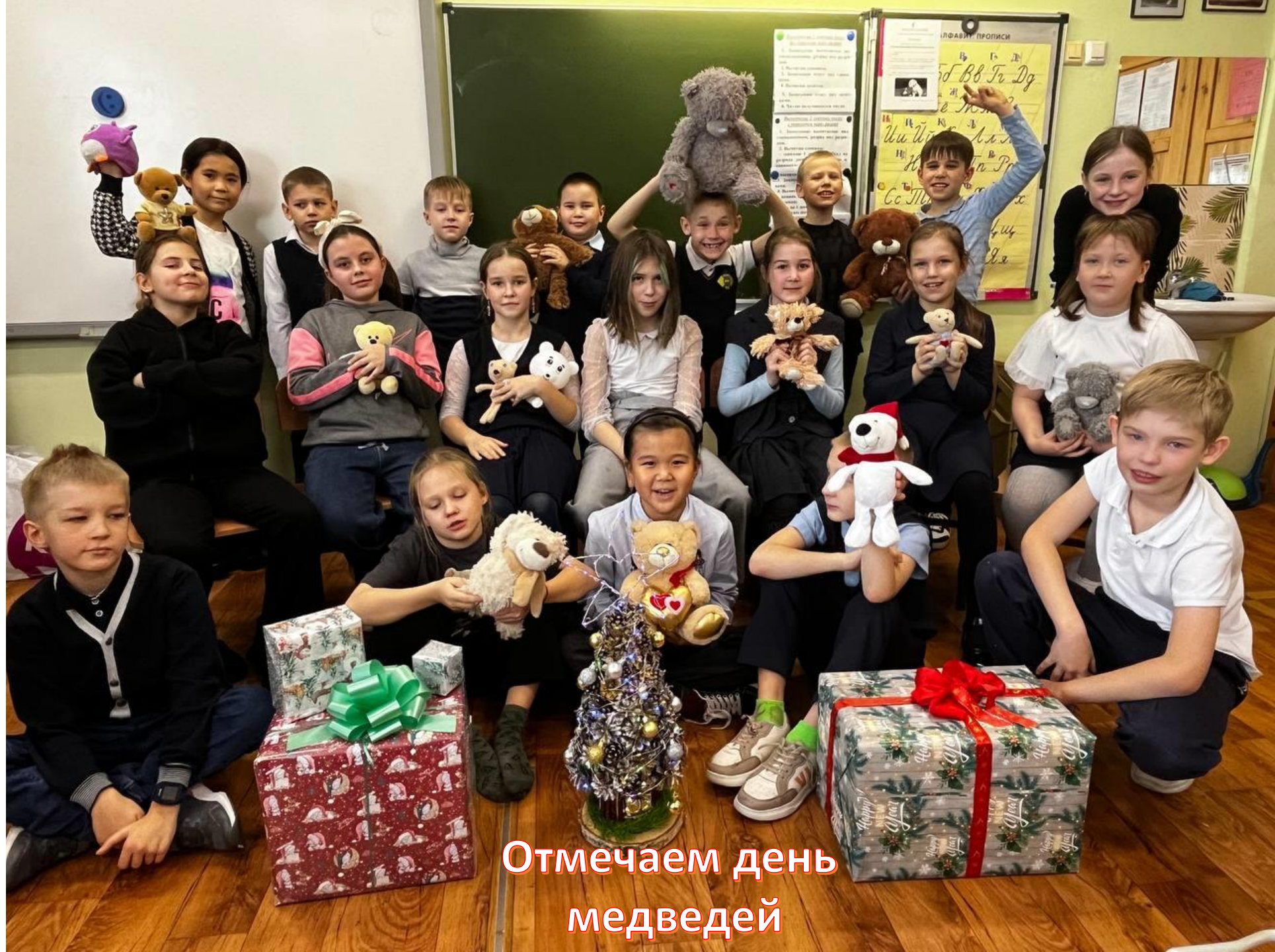
Отмечаем день медведей